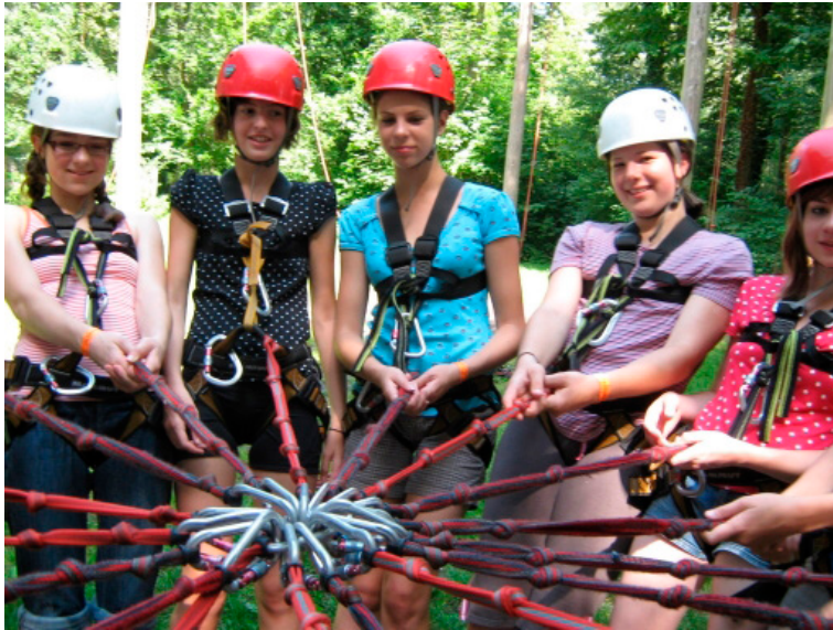
Auch der Spaß kommt nicht zu kurz – Ausloten der physikalischen Grenzen im Hochseilgarten